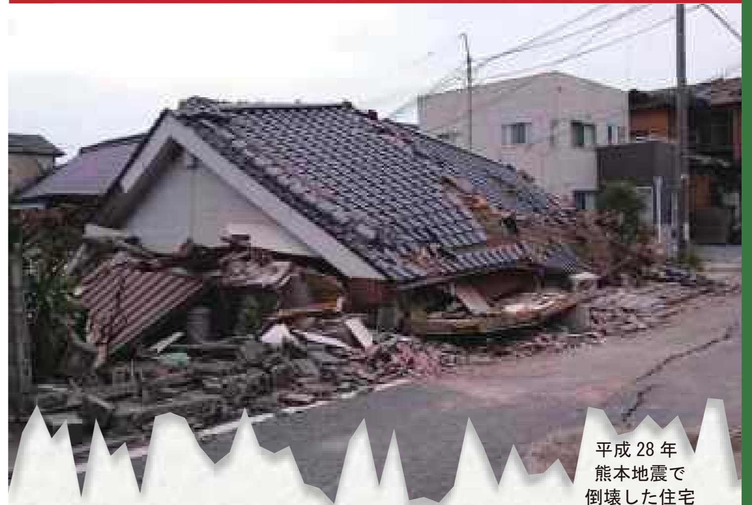
平成28年 熊本地震で 倒壊した住宅